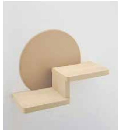
大建 ねこステップ

日曜大工でやる方もいると思います、工事としては棚板をつけるというだけです。猫棚とかキャットウォークとか言いますね。