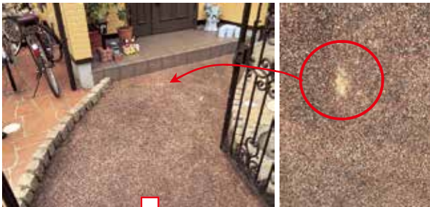
工事前 洗い出し仕上げ

元々は、「洗い出し」という仕上げがのアプローチです。 洗い出しは砂利を固めた仕上げ材ですので、場所によっては年数が経つとぼろぼろ取れてきたり、色が薄くなってきたりします。 そこで今回は、石張りにリフォームしました。