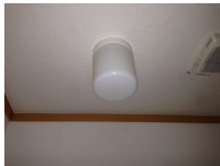
トイレなど小型照明